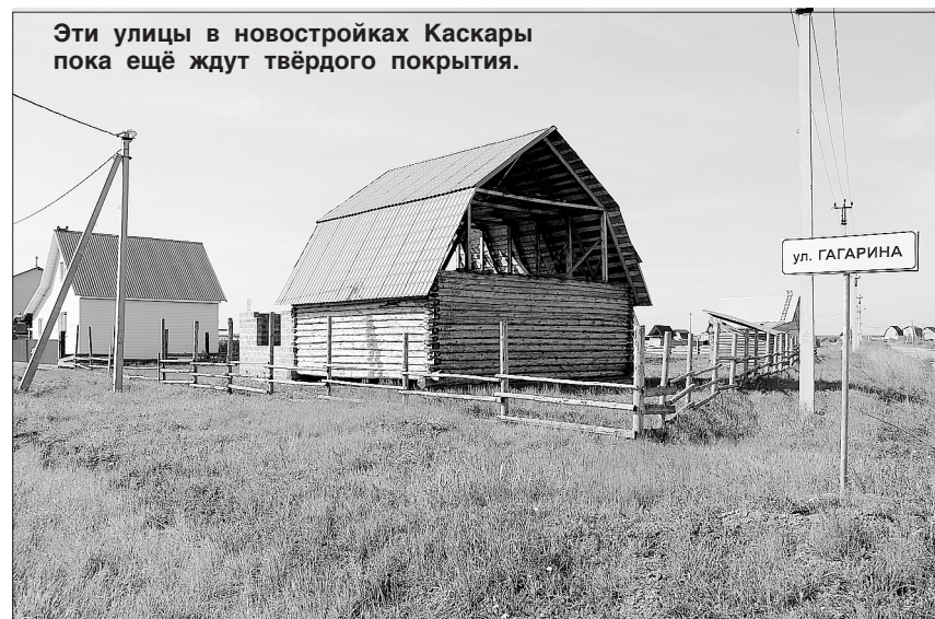
Эти улицы в новостройках Каскары пока ещё ждут твёрдого покрытия.

Эту огромную площадку, раскинувшуюся на сотне гектаров перед Каскарой, даже «жёлтая» пресса не рискнёт назвать «Тюменской Рублёвкой»: нет здесь трёхэтажных особняков с башнями и кованых ворот с вензелями. Добротные одноэтажные дома под разноцветными крышами.