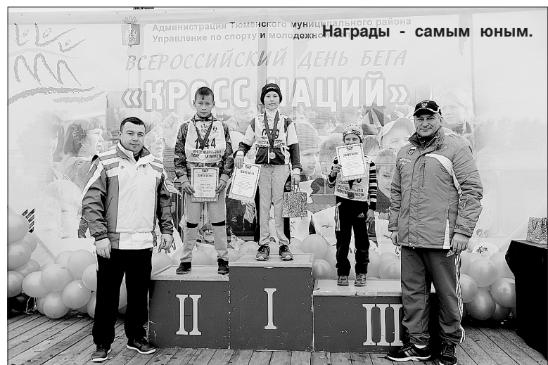
Награды - самым юным.

Получился большой, яркий и, что немаловажно, чётко, нескучно и нетрадиционно организован-