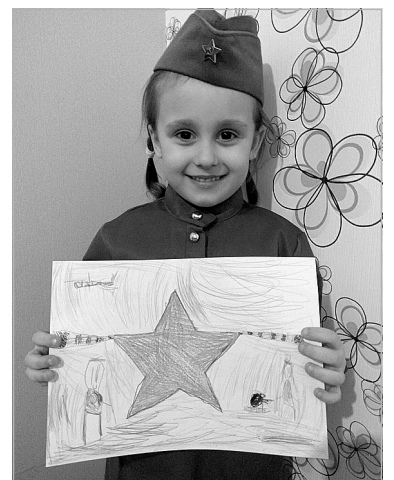
Дети готовят к Дню Победы рисунки и аппликации.

Дети из Червишевского детского сада готовятся к празднованию годовщины Победы вместе с родителями. Сейчас ребята рисуют и делают аппликации для выставки, а также учат стихи на конкурс чтецов, который обязательно состоится, когда дети вновь вернутся в детский сад.