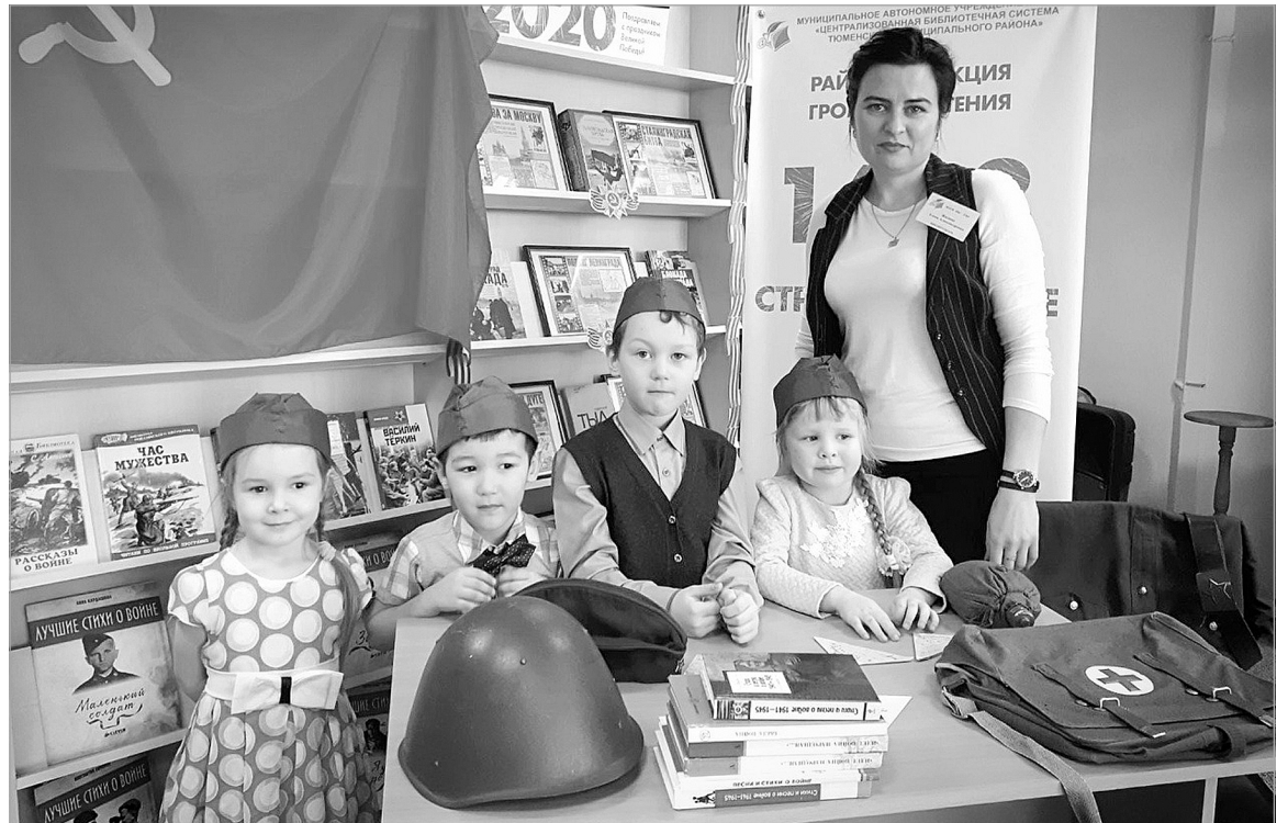
В акции «1418 строк о войне» приняли участие представители разных поколений.