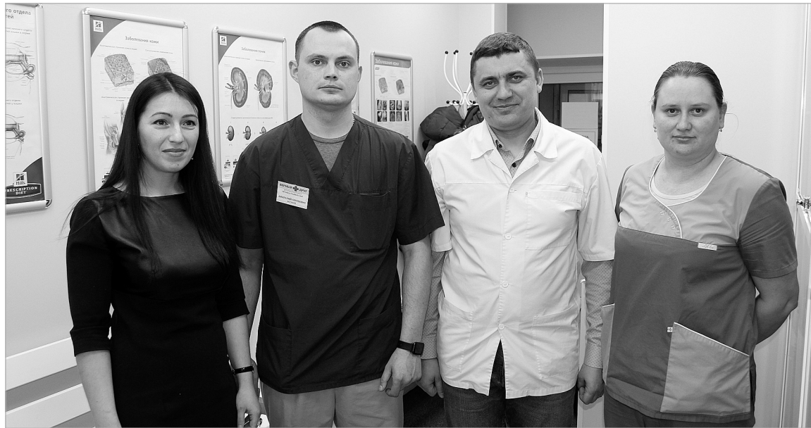
Сотрудники ветклиники «Верный друг».