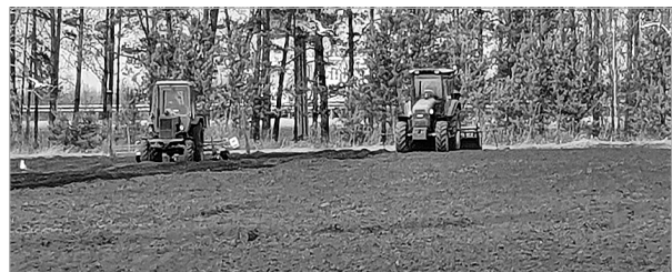
В ООО «Агротеховощ» засеяли морковью первые 5 гектаров полей.

Единая горячая линия по вопросам коронавирусной инфекции