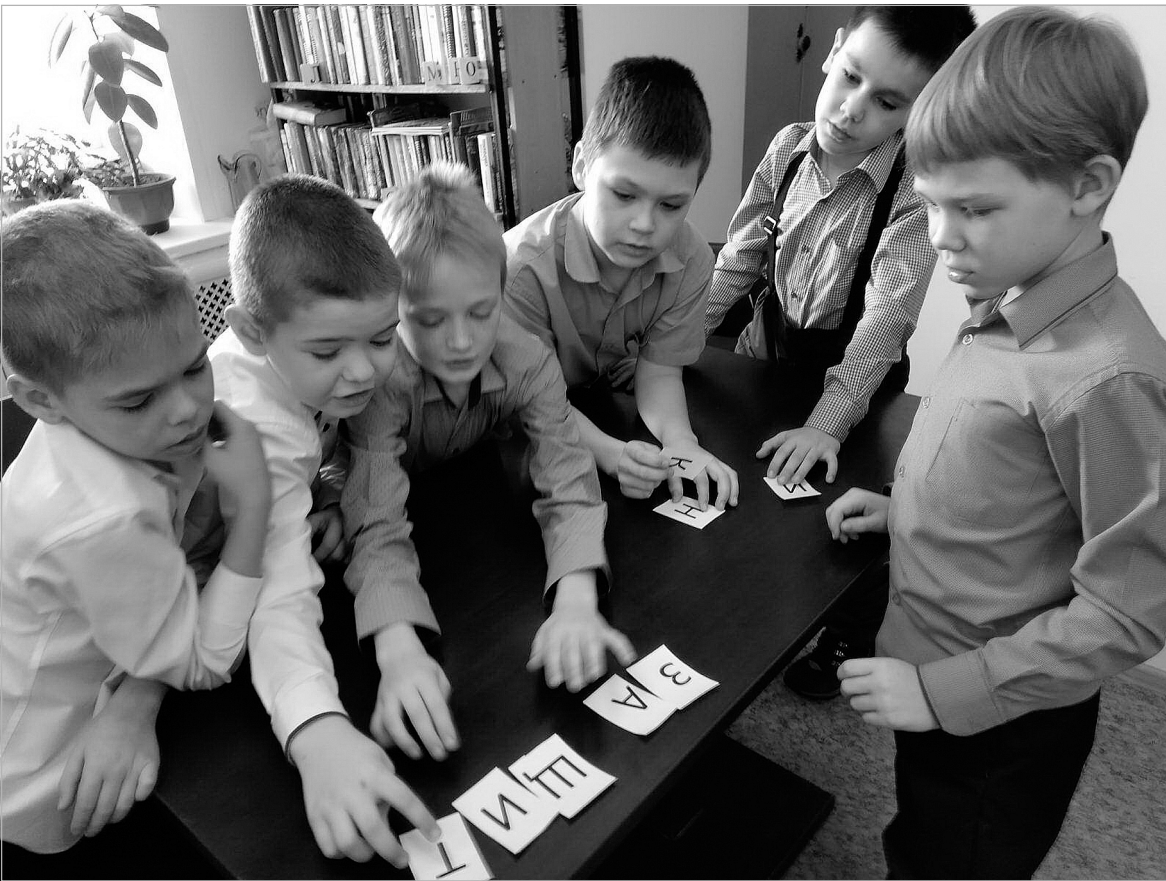
Команда второклассников выполняет задание.