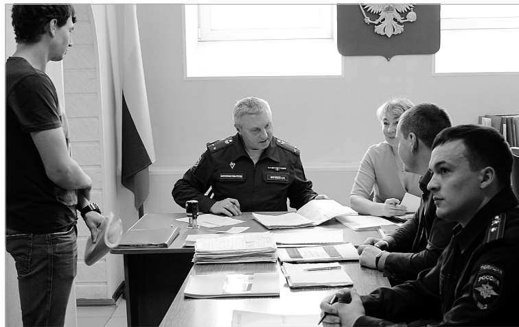
В военкомате работает призывная комиссия.