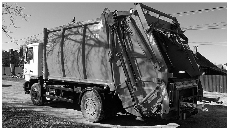
Этот мусоровоз повышенной вместимости будет работать в Тюменском районе.

Сейчас специалисты регионального оператора совместно с администрациями муниципальных образований проводят последние подготовительные процедуры. Например, уже в апреле очередная партия новых контейнеров появится на улицах Богандинского, Мальково, Муллашей.