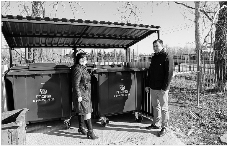
В Винзилях решили, что контейнерных площадок в растущем поселке должно быть больше.

По мнению главы Винзилинского МО, новые объекты для сбора ТКО простимулируют жителей поселка соблюдать чистоту и порядок.