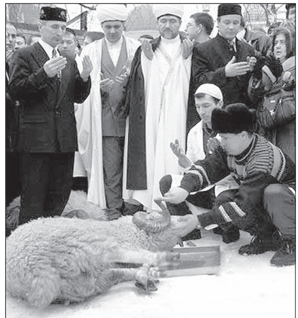
Подборку подготовила Гильсина КОЛЧАКОВА, с. Чикча.

кто в силу своего возраста, болезней не смог прийти на праздник. Члены совета ветеранов поздравили их дома, вручили подарки.