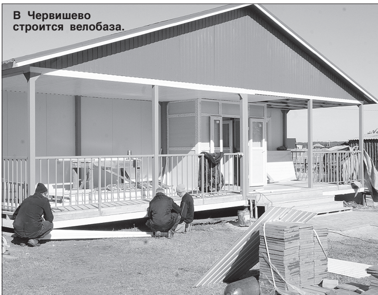
В Червишево строится велобаза.

Спорт в Тюменском районе всегда был предметом особой гордости. Теперь рекордов, а, следовательно, и поводов для гордости будет ещё больше.