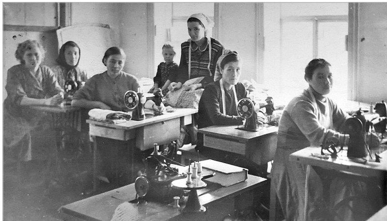
В швейной мастерской Ембаево.

Здесь было удобно работать и встречать заказчиков. В самом начале для глажки изделий пользовались чугунными