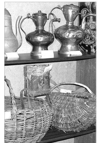
Все эти экспонаты принесли в музей жители Ембаево и Тураевой.

В Международный день музеев от души хочется пожелать сотрудникам музея поддержки и понимания, реализации намеченных планов и личных побед.