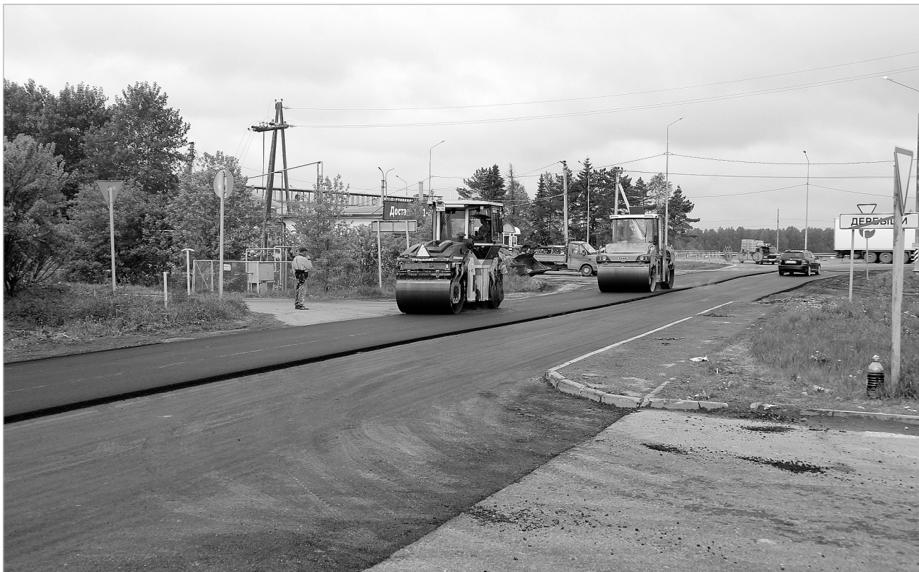
Выезд из Дербышей на федеральную трассу будет удобным для автомобилистов.