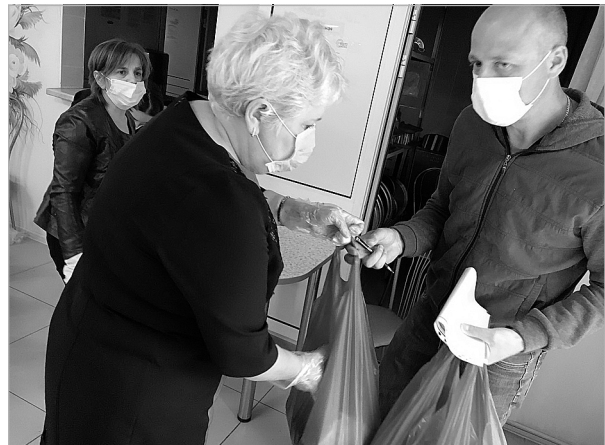
В Яровской школе родители получили для детей 151 продуктовый набор.

По материалам оперативного штаба Тюменской области по профилактике коронавируса.