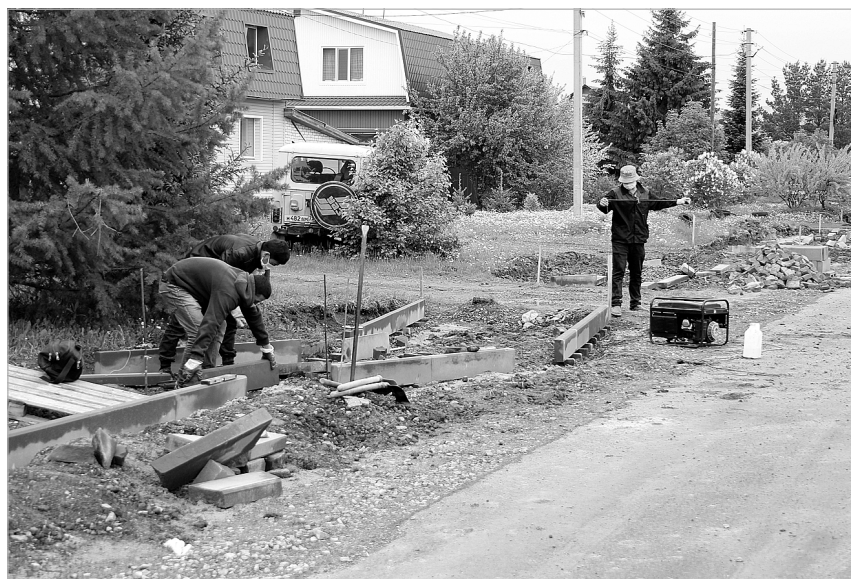
На этой улице в п.Московский появится и новое дорожное покрытие, и тротуар.