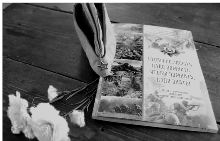
В Ембаево издали книгу о воинах-земляках.

всем этим сотрудники музея успешно справляются. Кроме того, они встречают гостей из соседних районов, городов России, ближнего и дальнего зарубежья. На высоком уровне проводят экскурсии, демонстрируют экспозиции и выставки, накрывают стол с национальным угощением, организуют выставки вне музея, занимаются с юными экскурсоводами, открывают страницы в социальных сетях, где рассказывают о своих земляках – героях Великой Отечественной войны, о героях-пограничниках, героях вой-