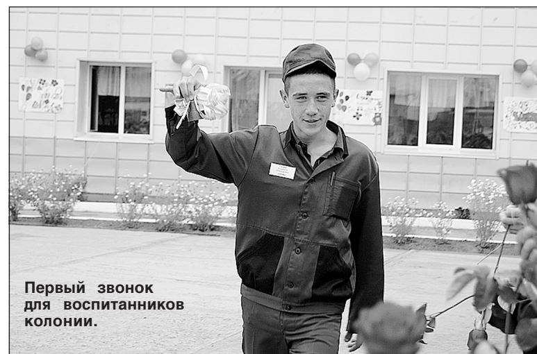
Первый звонок для воспитанников колонии.