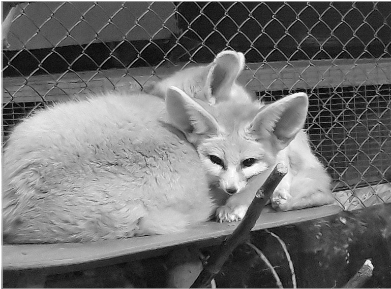
Обитатели зоопарка под Винзилиями.