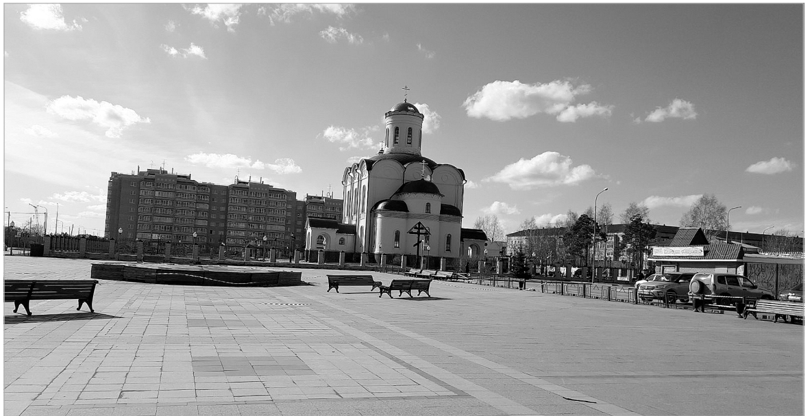
На Никольской площади поселка – ни души.