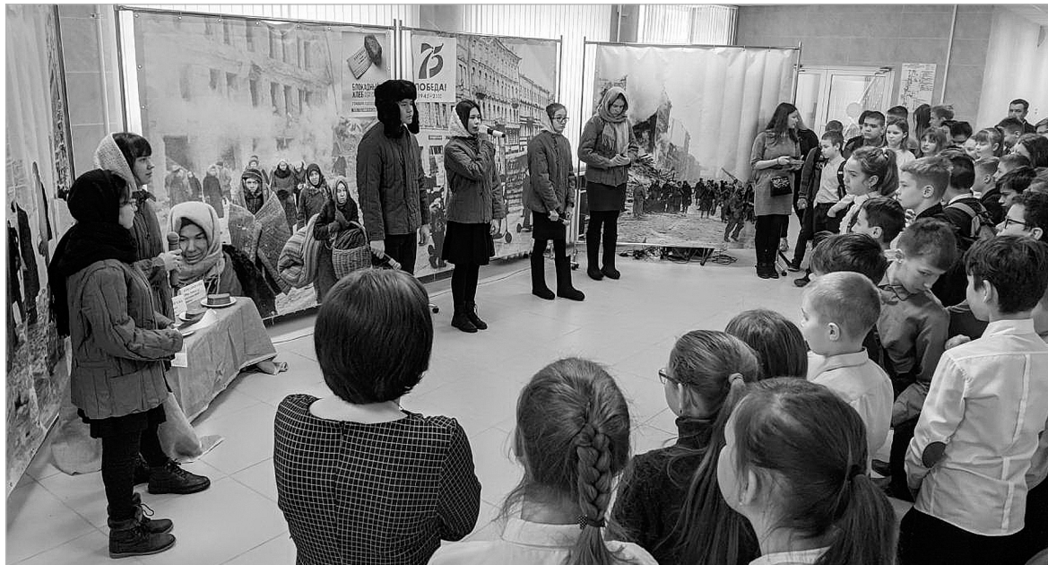
Основная творческая идея проекта – «оживить» исторические факты.