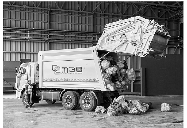
ООО «ТЭО» отвечает за организацию всей цепочки обращения с коммунальными отходами.

Отсортированные материалы реализуются на открытой электронной торговой площадке и в конечном итоге направляются на