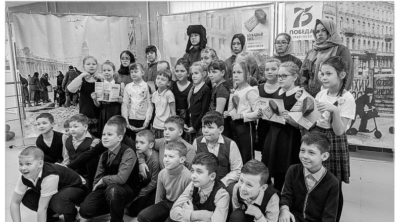
Школьники с интересом участвуют в проекте.

Ембаевский сельский музей подготовил выставку «Дети Невы». В рамках проекта теат-