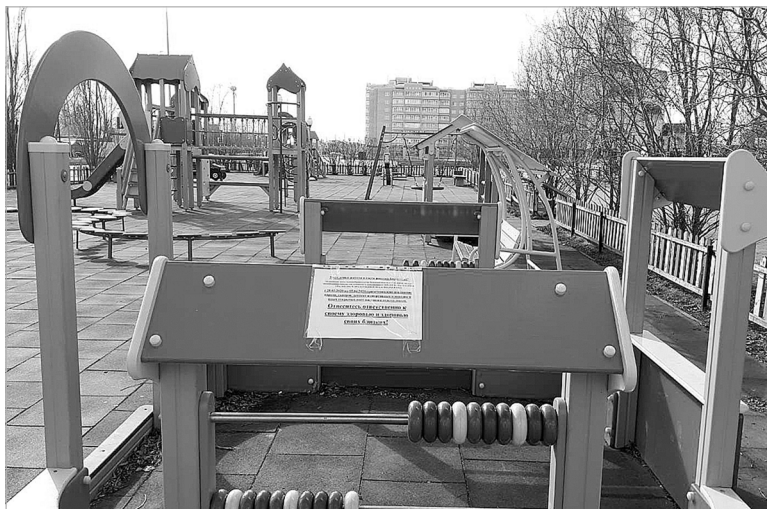
Детские площадки никто не посещает.

Поселок Боровский – самый крупный населенный пункт Тюменского района.