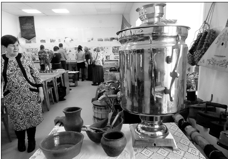
Среди экспонатов музея – множество предметов быта, которые принесли жители села.