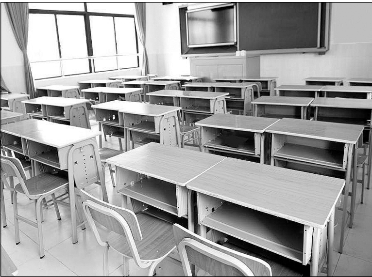
Классы в школах опустели.