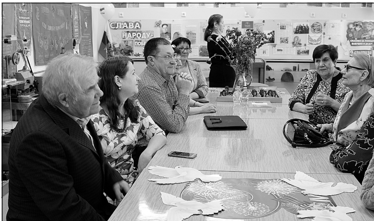
Участники встречи считают очень важным возрождение музея в Борках.

В селе Борки открыли школьный музей. Это стало долгожданным событием для односельчан.