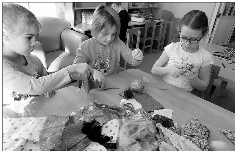
Дети попробовали сами смастерить куклы.

В структурном подразделении Переваловской школы «Золотая рыбка» стартовал проект «Русская народная кукла».