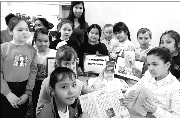
Чикчинские школьники – за безопасный интернет.