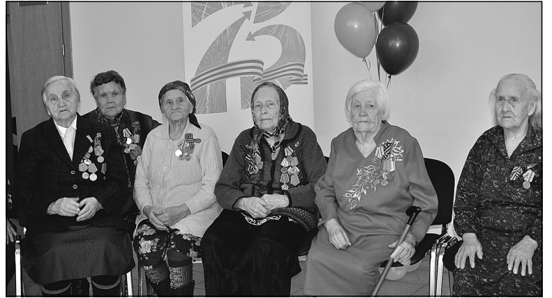
Всем труженикам тыла Боровского муниципального образования в феврале и марте вручены памятные медали.

В муниципальном образовании поселок Боровский состоялось торжественное вручение юбилейных медалей «75 лет Победы в Великой Отечественной войне».