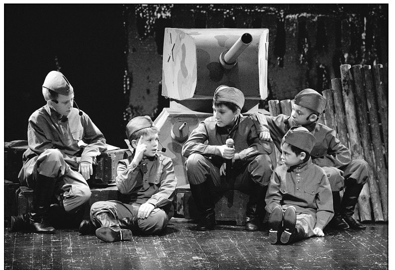
Выступления детей, принявших участие в театрализованном представлении, никого не оставили равнодушными.

«Не забывайте грозные года, Когда кипела грозная вода. Земля тонула в ярости огня. И не было ни ночи, и ни дня.»