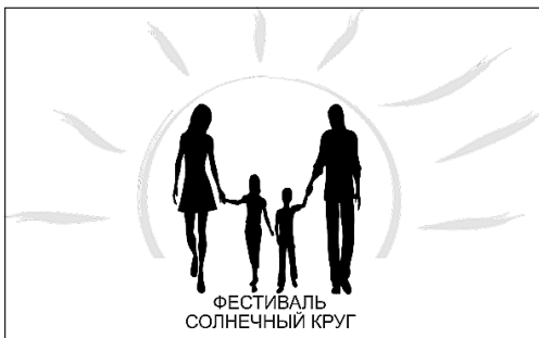
ФЕСТИВАЛЬ СОЛНЕЧНЫЙ КРУГ

Масштабный проект запустил центр культуры и досуга «Премьера» на своих территориях: фестиваль «Солнечный круг» планирует объединить множество семей Богандинского, Червишевского и Онохинского муниципальных образований.