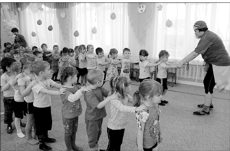
Администрация СК «Боровский».

По итогам соревнований 1 место заняла команда «Зелёные мячи» (группа «Растишки»), 2 место – «Красные мячи» («Почемучки»), 3 место – «Фи-