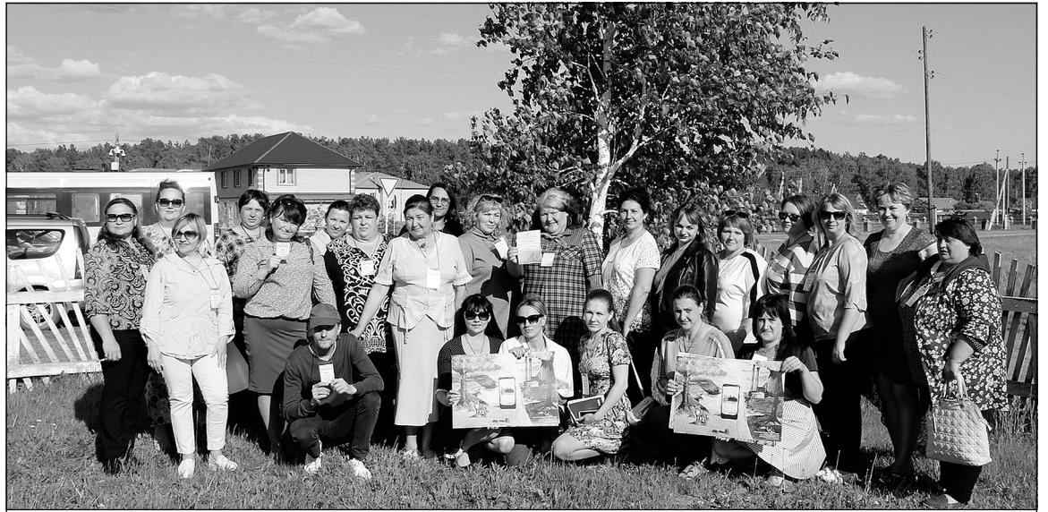
Участники форума «Экологическое ассорти».