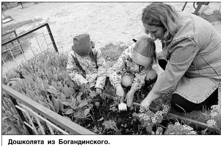
Дошколята из Богандинского.

детей расслабляющее, здесь они отдыхают психологически.