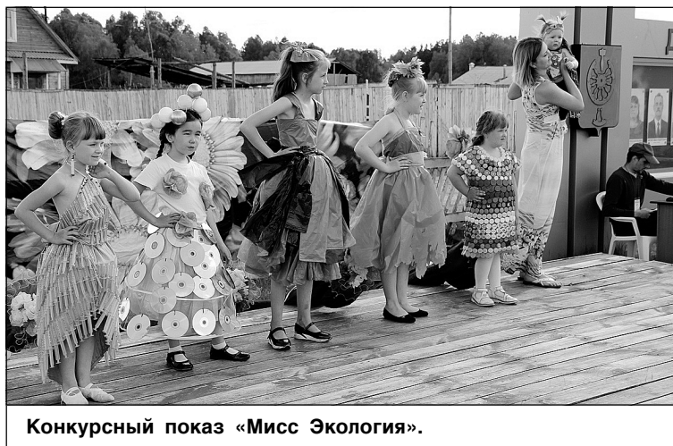
Конкурсный показ «Мисс Экология».

литься своими наработками с коллегами из других учреждений Тюменского района.