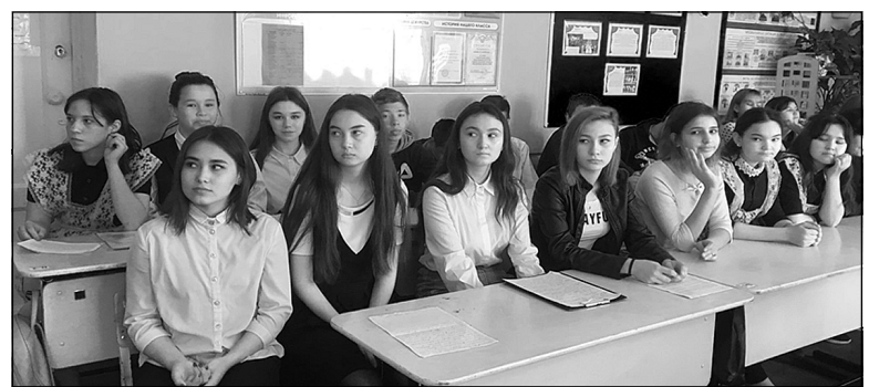
Школьники – самые внимательные слушатели.