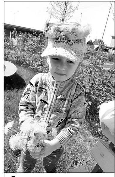
Одуванчик – растение полезное.