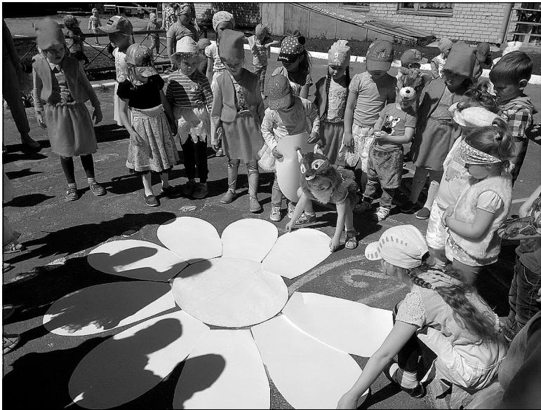
Праздник в новотуринском «Лукоморье».