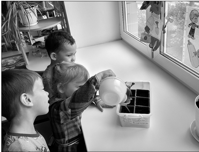
Эколята структурного подразделения Переваловской школы.