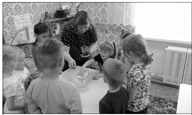
Юные усенцы – будущие экологи.

Есть на территории детского сада и «Зеленая лаборатория под открытым небом». Ребята наблюдают за развитием разнообразных растений и ухаживают за ними. Они очень гордятся своими успехами. Заботясь о природе, наши воспитанники не будут зря рвать цветы, ломать ветки. Важно отметить, что наше «Огородное царство – овощное государство» еще и действует на