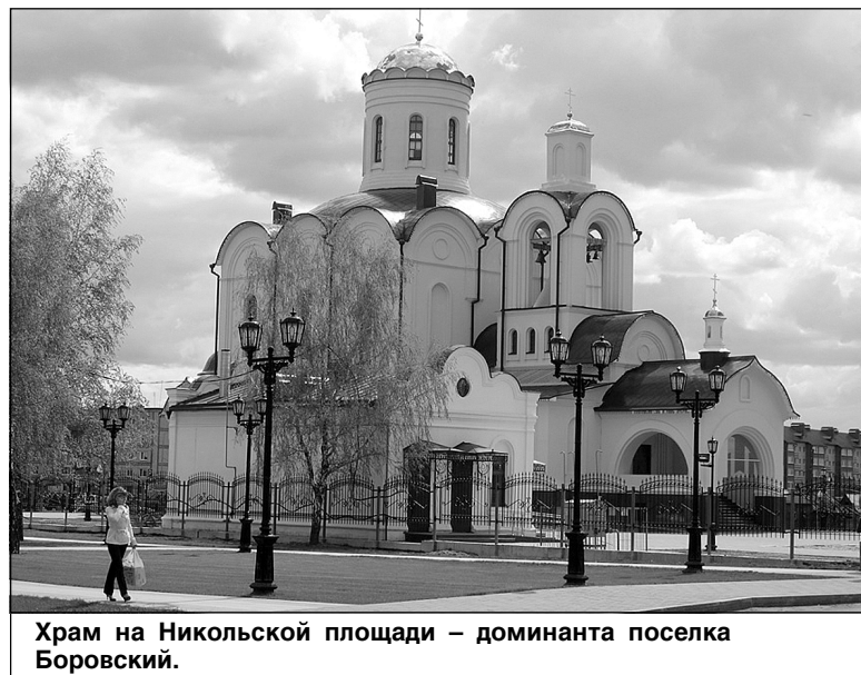
Храм на Никольской площади – доминанта поселка Боровский.

табной за годы организации подобных мероприятий, с рекордным числом компаний-участников.