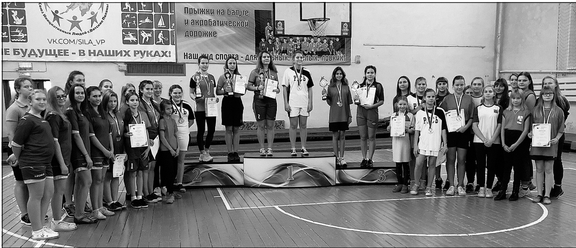
Победители первенства России.