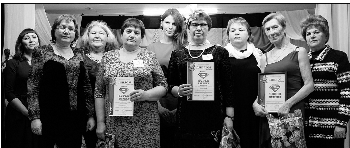
Участницы конкурса «Супербабушка» и его организаторы.

На конкурс «Супербабушка» в Княжевском клубе заявили пять участниц, показав себя во всей красе.