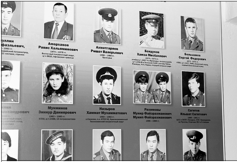
На стенде в музее – лица пограничников.