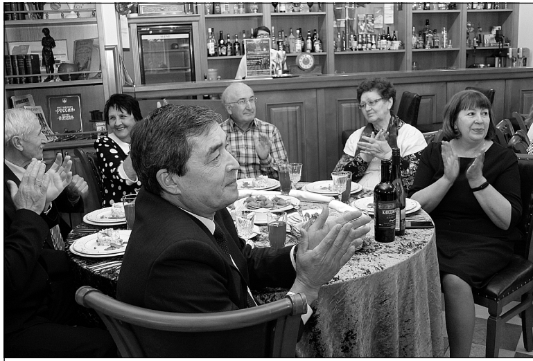
Они и сегодня сохранили комсомольский задор.