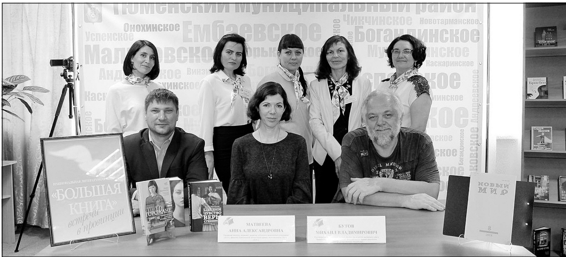
Встреча с писателями в Винзилинской библиотеке.