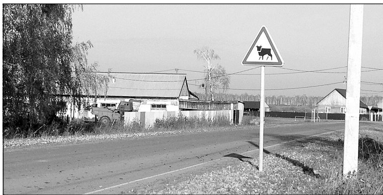
Знак «Перегон скота» в Нариманово не редкость.