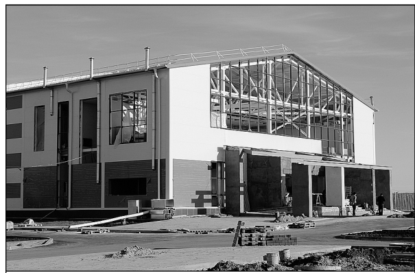
Строительство спорткомплекса в Мальково – на стадии завершения.