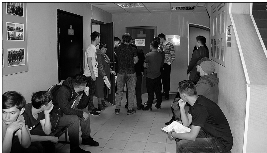
В ожидании вызова на призывную комиссию.

Ребята приходят в военкомат еще до начала призыва, знакомятся с