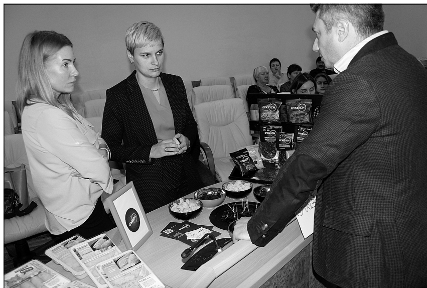
Участники встречи с интересом познакомились с продукцией местных товаропроизводителей.