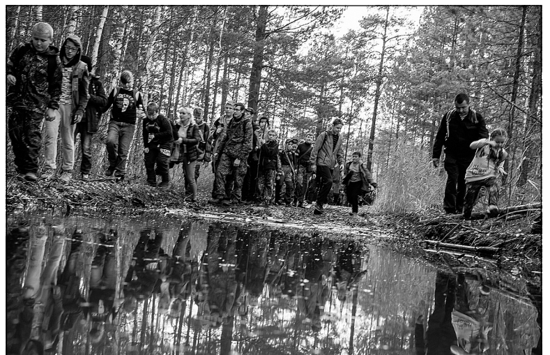
Местами дорогу, проторенную предками, залило дождями, и ее пришлось обходить по лесу. В результате 22 километра пути превратились в 27.