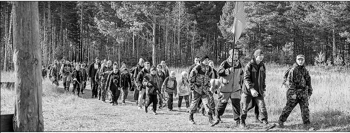
Колонна участников кросс-похода вошла в лесной массив.