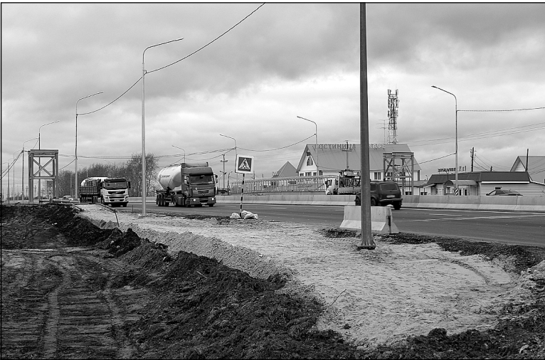
На федеральной трассе в районе Борков ремонт близится к завершению.