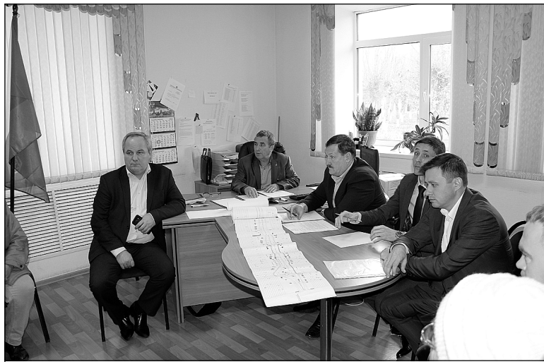
Участники встречи в администрации Борковского МО.