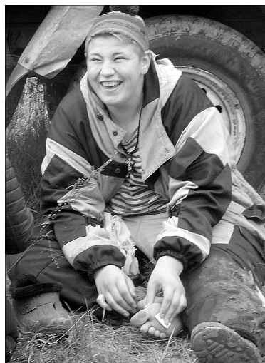
Даже мозоли, натертые в пути, не испортили настроения.