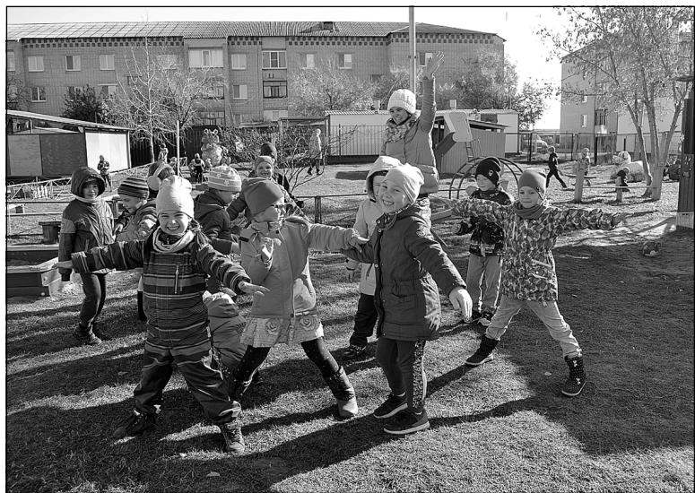
«Смешарикам» на прогулке никогда не бывает скучно.

В сентябре 2019 года я пришла на работу в Червишевский детский сад «Сибирячок» на должность воспитателя в подготовительную группу «Смешарики».