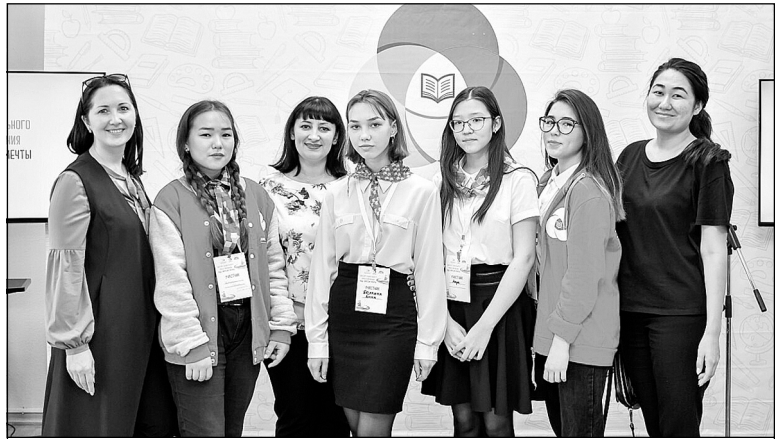
Участники «Школы социального проектирования» и их кураторы.