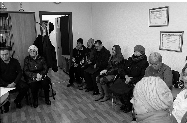
Жители за скорейшее решение транспортных проблем.