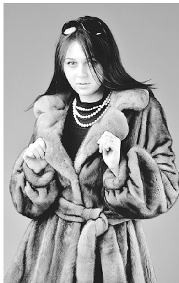
«Русфинанбанк» Ген. лиценз. ЦБ РФ N 1792.

ВЫСТАВКА-ПРОДАЖА состоится в ДК п.Богандинский, ул.Юбилейная, 3а с 9.00 до 19.00