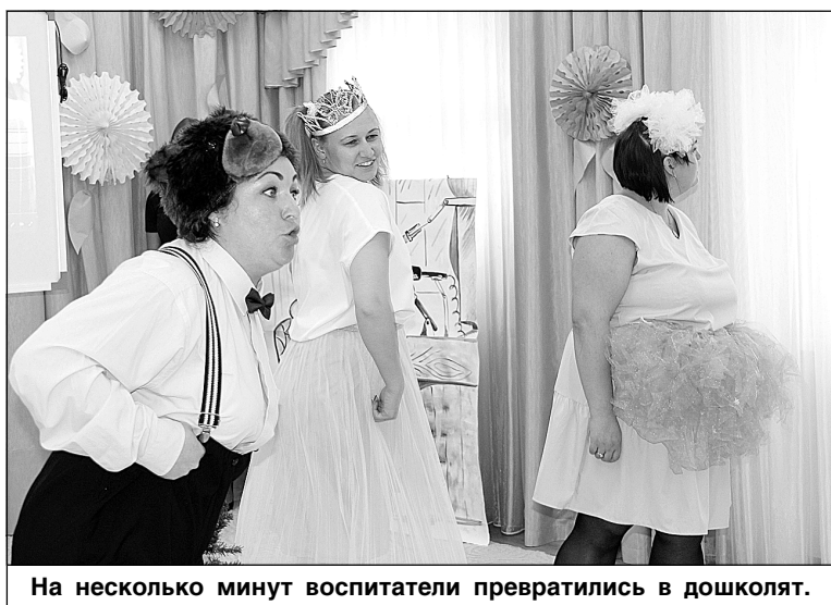
На несколько минут воспитатели превратились в дошколят.