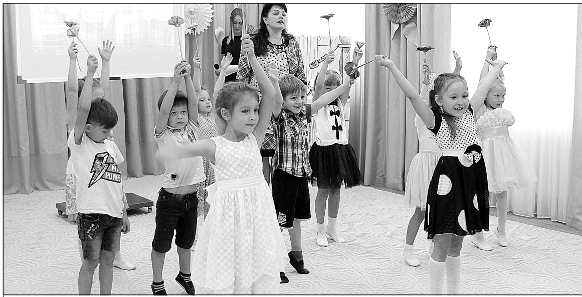
Самые лучшие поздравления – от воспитанников.