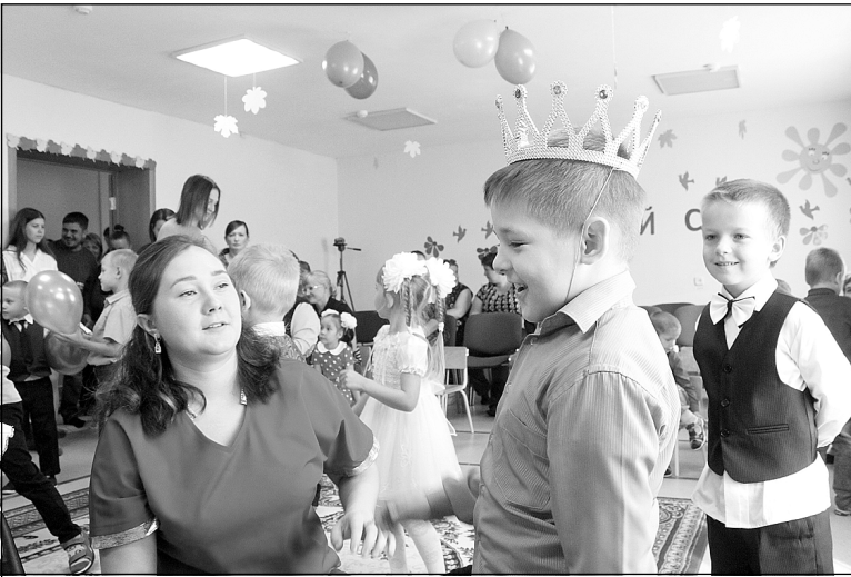
В день открытия группы был большой праздник.