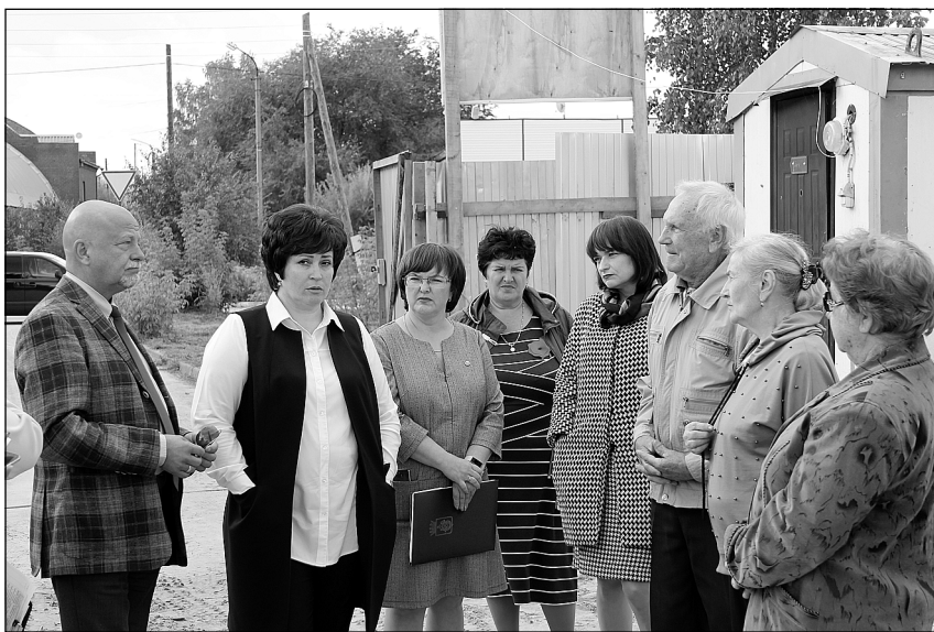
О здравоохранении – на чистоту.

как с жителями, так и с учреждениями бюджетной сферы.