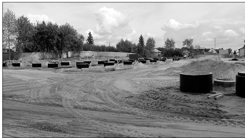
На этом месте к концу года вырастет здание новой поликлиники.