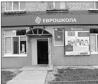
Винзили – первое поселение в районе, где есть своя «Еврошкола».