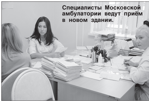
Специалисты Московской амбулатории ведут приём в новом здании.

О комплексе организационно-технических мероприятий, направленных на повышение доступности медицинской помощи для населения «столичного», рассказал главный врач областной больницы N 19 Владимир Лобацевич. Он подчеркнул, что они включают в себя несколько направлений работ: укрепление материально-технической базы, кадровое обеспечение медицинских учреждений