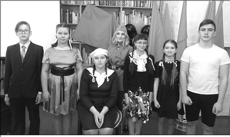
Участники встречи в библиотеке.