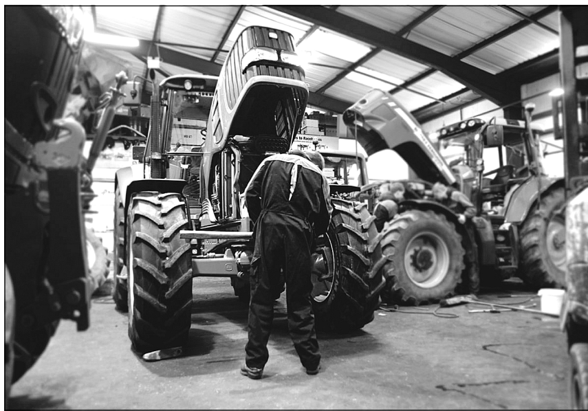
Тракторы в «столичном» отремонтированы на 97%.

Активно приобретают новую технику ПАО «Птицефабрика «Боровская», АО «Успенское» и ЗАО «Птицефабрика «Пышминская». В остальных хозяйствах «столичного» значительная часть тракторов и комбайнов требует обновления. Как отметил заместитель начальника управ-