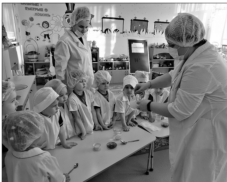
Дети с интересом участвовали в экспериментах и наблюдали за окружающей средой.

В течение недели в работе с детьми педагоги использовали загадки на тему явлений природы и предметов; беседы «Отку-