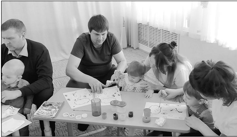
Вместе с мамами, вместе с папами.