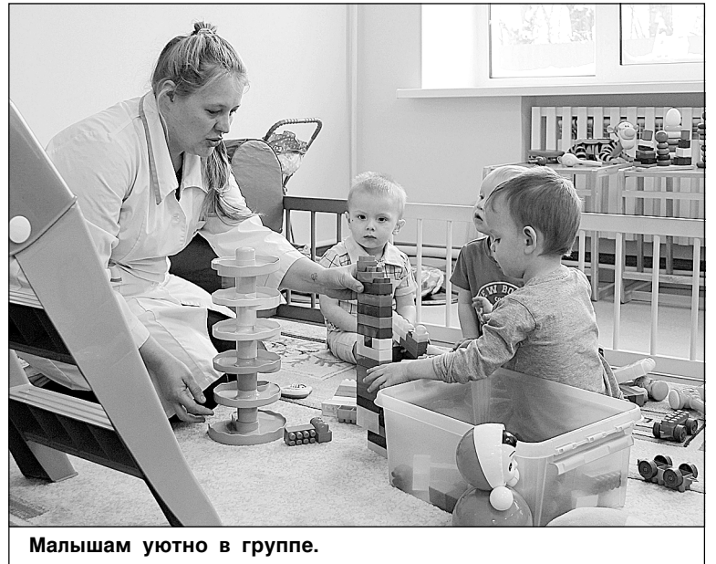
Малышам уютно в группе.