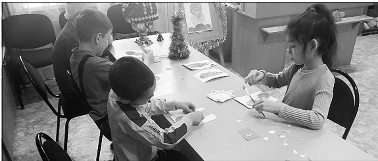
Мастер-класс по изготовлению аппликаций.

В январе 2020 года в структурном подразделении Червишевской сельской библиотеки прошел литературный час «Братья Гримм и их сказки».