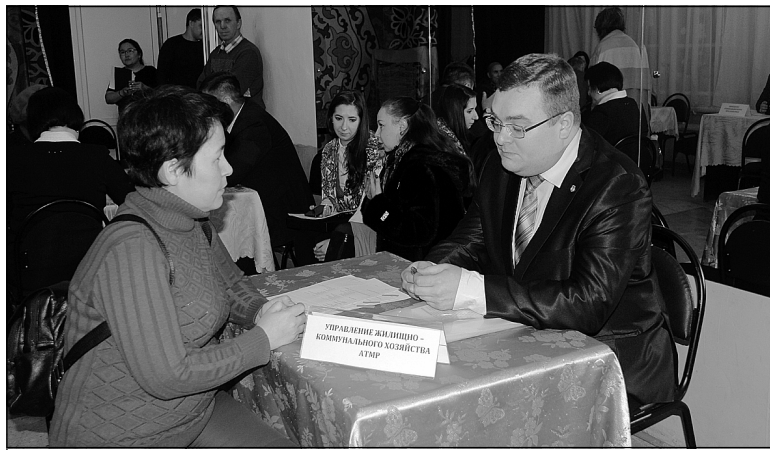
Перед началом собрания жители территории побывали на личном приеме у руководства Тюменского района.

Чикчинское МО развивается, как и все территории «столичного». В 2019-м в поселение прибыли 427 человек. За год родилось 57 младенцев, умерли 27 человек. Численность населения