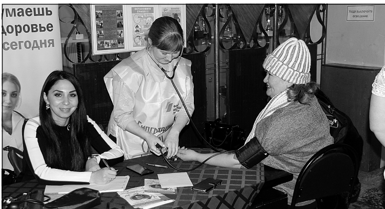
Сельские медики предлагали жителям измерить давление и проводили профилактические беседы.