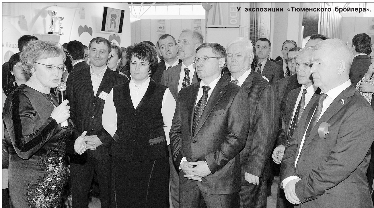
У экспозиции «Тюменского бройлера».

Тюменские предприятия АПК представили на выставке «Золотая осень» свои новинки. В их числе, например, такие необычные продукты, как бишоколад, биоконфитур, варенье из сосновой шишки.