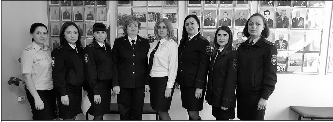
Сотрудники подразделения по делам несовершеннолетних Тюменского района.