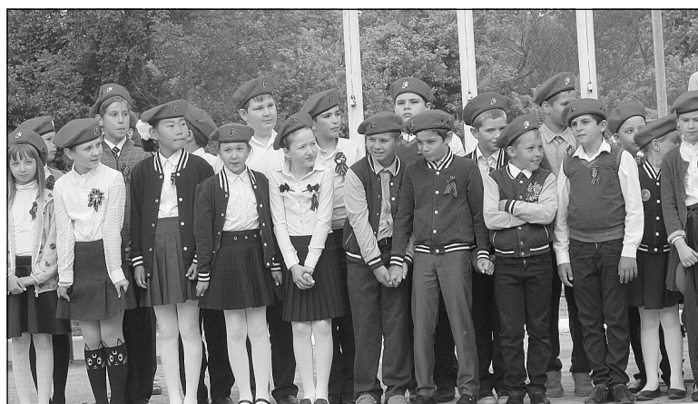
В Молькинской школе Краснодарского края биографию наримановского героя знает каждый ученик.

В Цхинвали мы присутствовали на митинге, посвященном памяти погибшим. Кругом плачущие люди, народу много – из Северной и Южной Осетии, многочисленные гости со всех уголков страны, много военнослужащих с автоматами... После выступлений