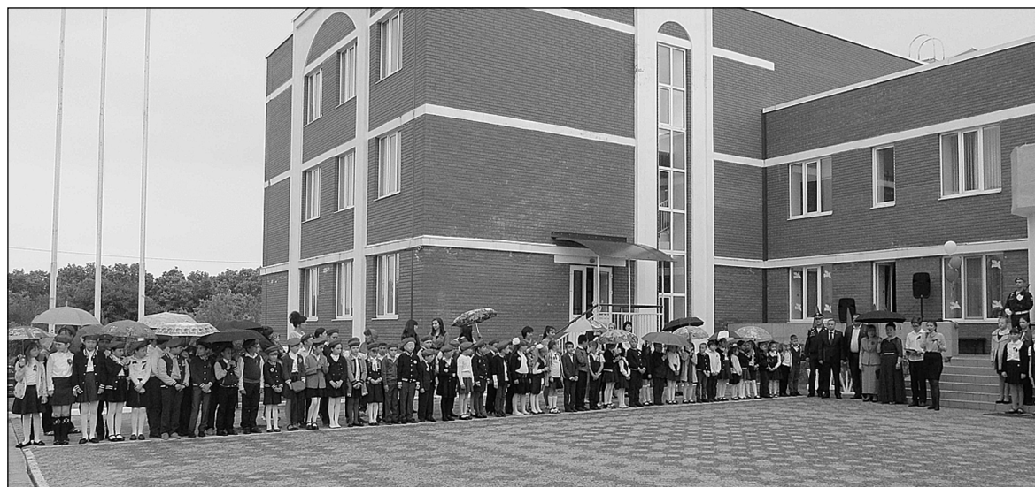
Новая красавица-школа удостоена имени Раушана.

пришла с опозданием помощь нашим миротворцам. Здесь даже годы спустя от увиденного и услышанного можно прийти в ужас. Что же говорить о том, как там выжили люди и какие нечеловеческие испытания легли на плечи наших ребят.