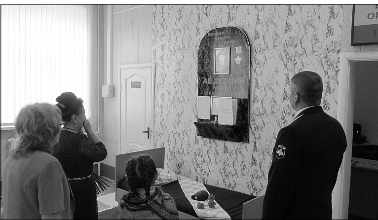
Казарма, где жил Герой России.