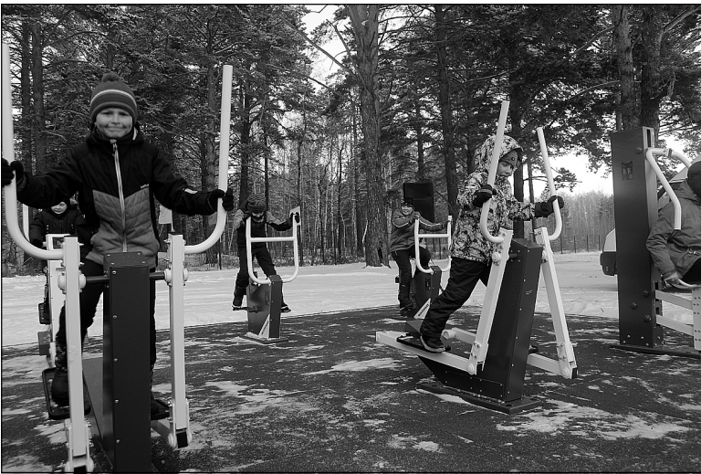
Жители поселка Богандинский с удовольствием тестировали новый тренажерный комплекс.