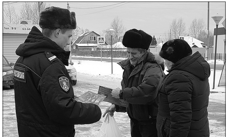
Сотрудники Росгвардии раздают жителям сел буклеты с информацией о том, как обеспечить безопасность.