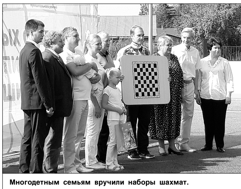
Многодетным семьям вручили наборы шахмат.

Международный гроссмейстер, чемпион мира по шахматам Анатолий Карпов, приехавший на фестиваль в «столичном», не только поздравил жителей райо-