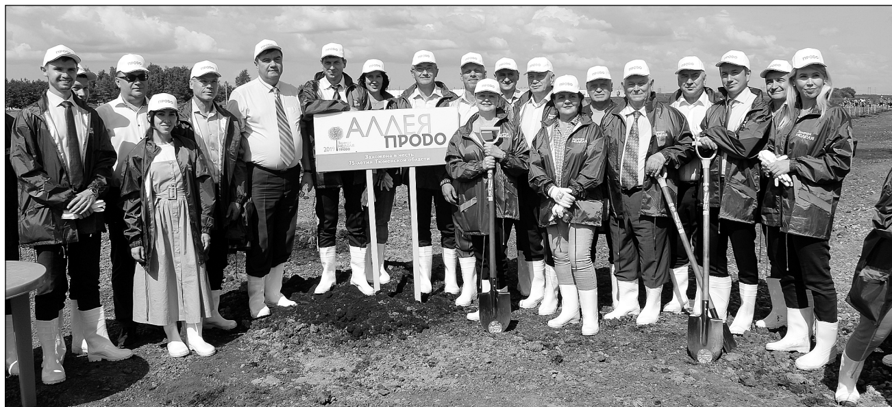
Группа участников «Зелёной недели».