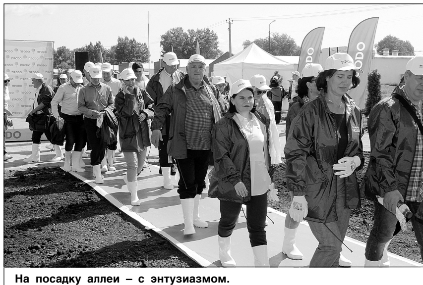
На посадку аллеи — с энтузиазмом.