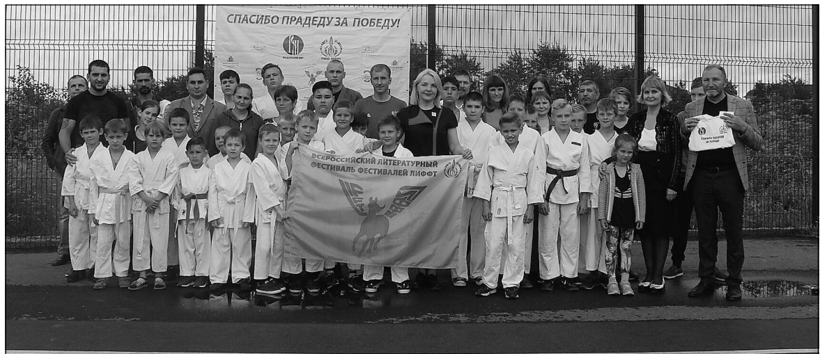
Участники поэтического конкурса и их гости.