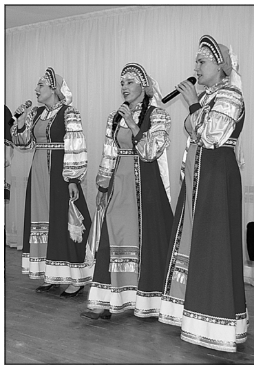
О песня русская...