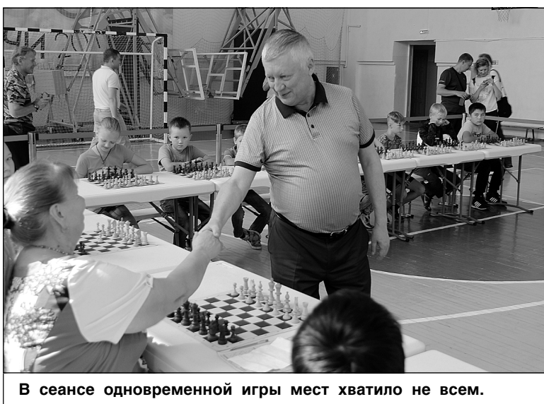
В сеансе одновременной игры мест хватило не всем.