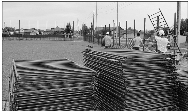
Монтаж спортивной площадки в Созонове.