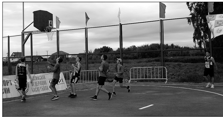
Жаркие баталии в прохладный день.

Среди юношей 2001-2002 г.р. первое место заняли ребята из Новотарманского МО, второе – из Салаирского, третье – из Ембаевского. Среди девушек места распределились так: первое