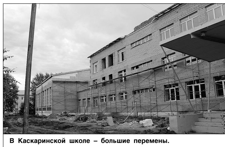
В Каскаринской школе – большие перемены.

В конце 2017-го в ДК «Юность» была заменена кровля и капитально отремонтирован зрительный зал, оснащенный после ре-