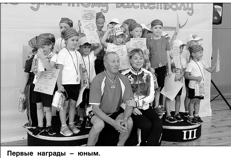
Первые награды – юным.

– Ембаево, второе – Каменка, третье – Богандинский.