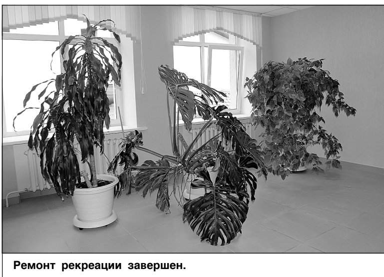
Ремонт рекреации завершён.