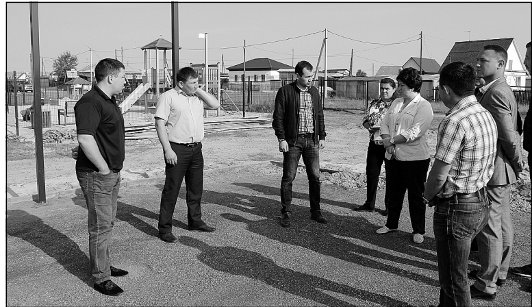
У депутатов поселка Андреевский есть предложения.

В селе Созоново и поселке Андреевский идет строительство мини-футбольных площадок с искусственным покрытием.