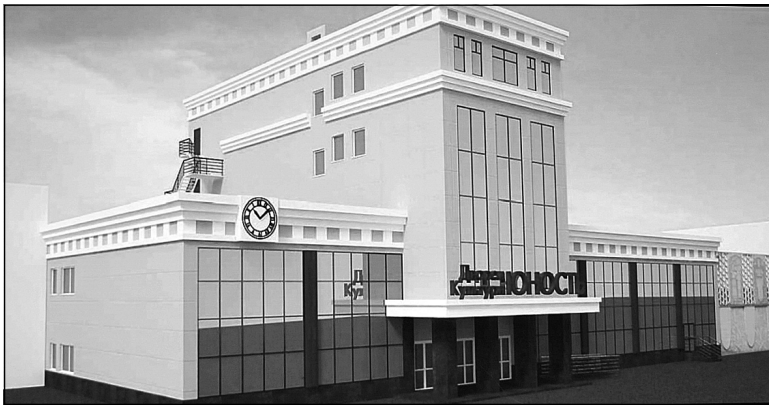
Таким будет ДК в Каскаре в 2020 году.