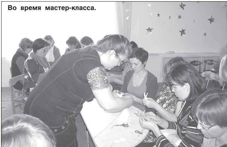
Во время мастер-класса.

Ответственная за выпуск приложения Татьяна ЮРТИНА (тел./факс 22-73-83, e-mail redzrek@rambler.ru).