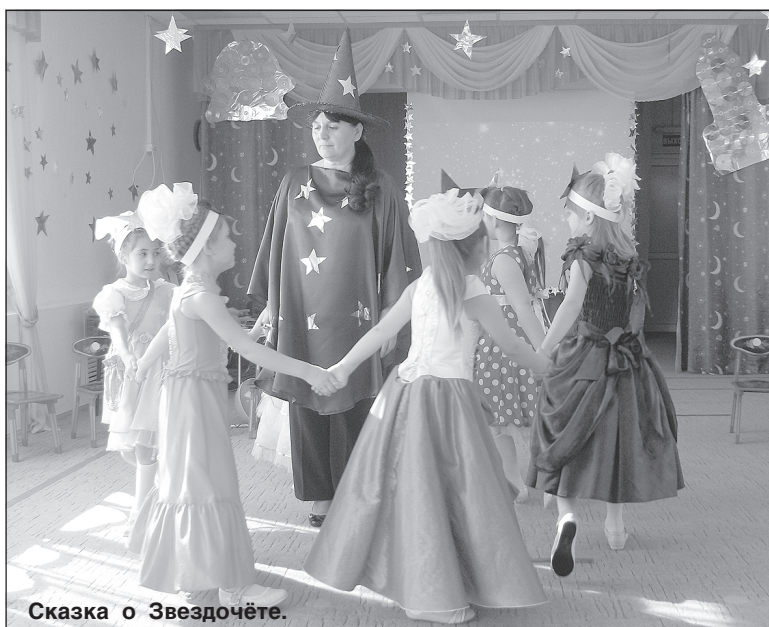
Сказка о Звездочёте.