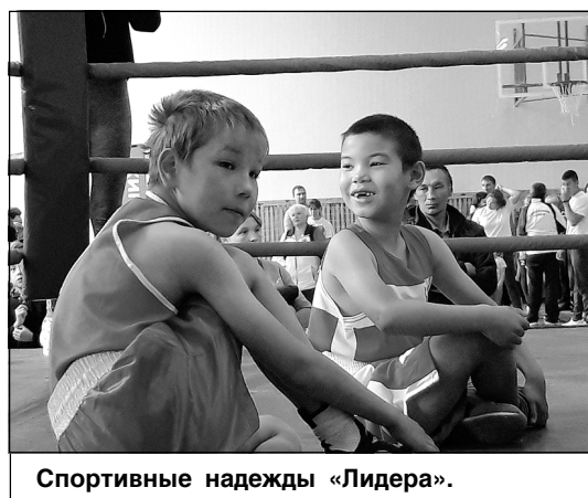
Спортивные надежды «Лидера».

Мария КОРАБЛЕВА, Фото автора и из группы «Лидер72» «ВКонтакте».