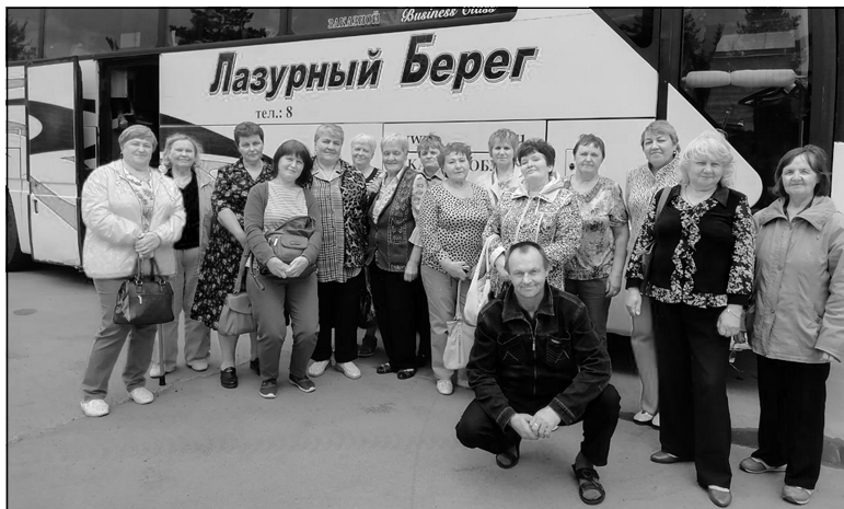
С «Лазурного берега» – в Тобольск.

Поездка участников Винзилинского клуба активного долголетия «Кладь» в город Тобольск была организована Центром социального обслуживания населения Тюменского района.