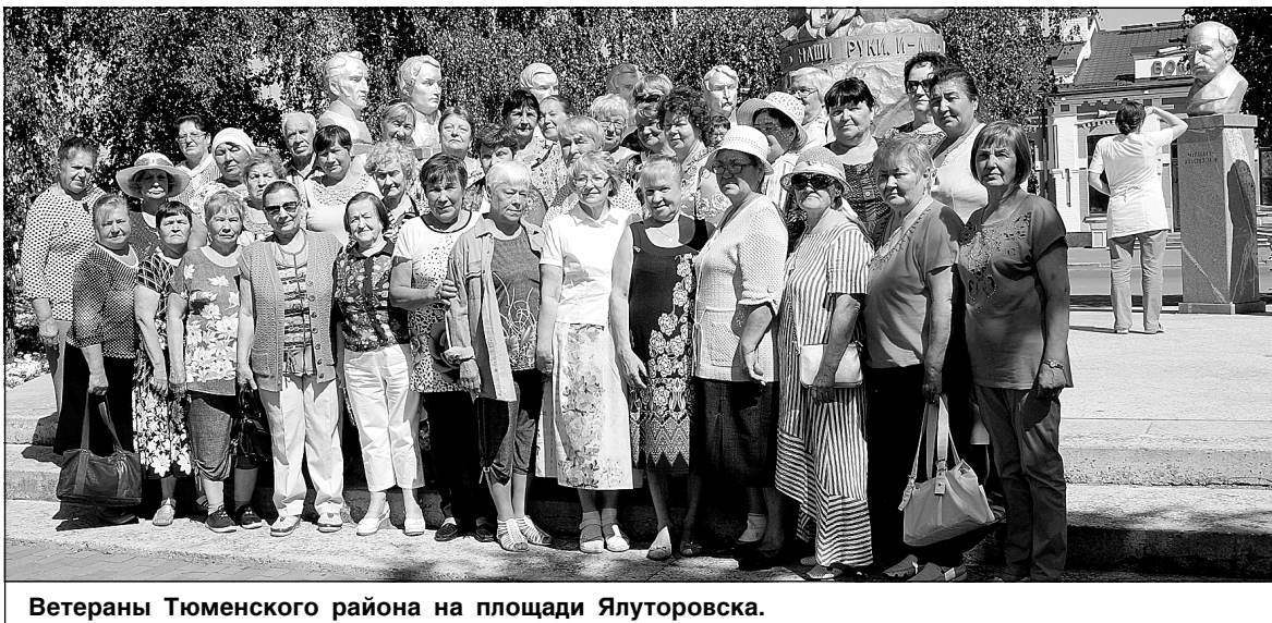
Ветераны Тюменского района на площади Ялуторовска.