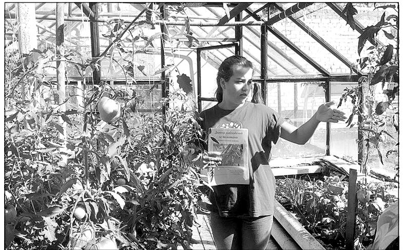
В теплице наливаются томаты.

Структурное подразделение дошкольного образования Богандинской школы №42 уже второй год участвует в реализации проекта «Зеленые лаборатории под открытым небом».