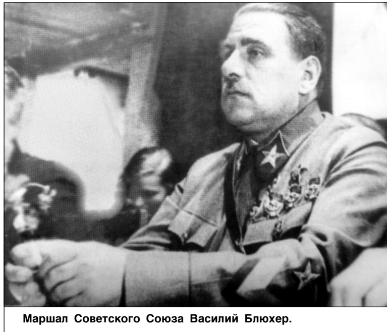
Маршал Советского Союза Василий Блюхер.

13-15 августа 1984 г. по Тобольскому тракту проходил конно-спортивный агитационный отряд, организованный по случаю 65-летия освобождения области от Колчаковских войск. В переходе по местам, где в 1919 г. шла сформированная стрелковая дивизия В.К.Блюхера, приняли участие сотрудники музея «Штаб-квартира В.К.Блюхера» и работники Тюменского горкома ВЛКСМ. Отряд состоял из членов городского комсомольско-молодежного клуба, тренеров и спортсменов