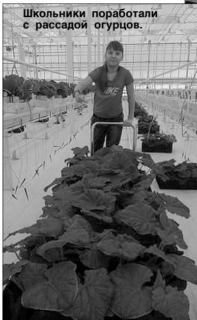
Школьники поработали с рассадой огурцов.