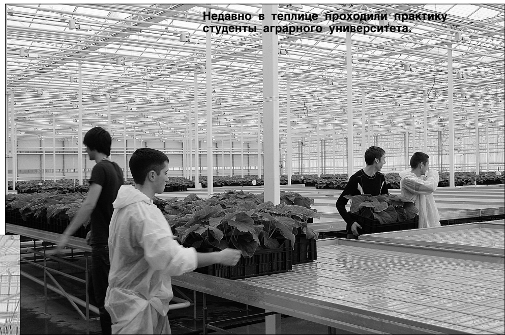
Недавно в теплице проходили практику студенты аграрного университета.

не только оказывали реальную помощь сотрудникам тепличного комбината, работая с огуречной рассадой, но и одновременно выполняли часть программы элективного курса «Агротех-