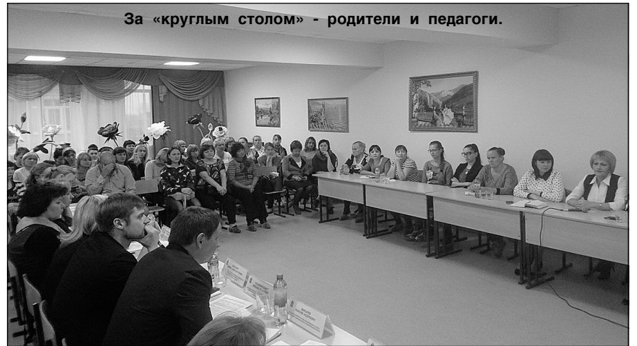
За «круглым столом» - родители и педагоги.

Основными вопросами обсуждения стали составление учебного плана, подвоз детей и оплата питания школьников через личный кабинет Сбербанка онлайн и другие.