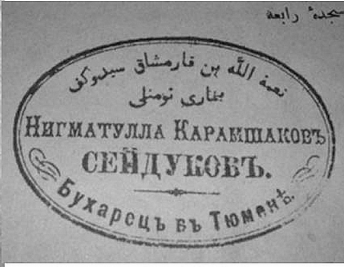
Родился в 1829 году в селе Ембаево (другое название Улы Манчыл). Это село, как и соседнее Тураево (Киши Манчыл), было основано торговцами из Бухары.

Строго говоря, торговля с посланцами Средней Азии велась много раньше: эти связи прослеживаются ещё с XIII-XIV веков. Однако этим отношениям мешали военные действия, которые велись при покорении Сибирского ханства. Лишь когда с татарами установился мир, а также исчезла угроза со стороны воинствующих степных кочевников, стало возможным возобновить традиционную торговлю.