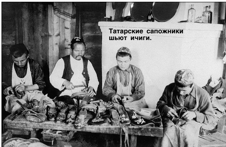
Татарские сапожники шьют ичиги.

Долгое время существовало устойчивое предубеждение относительно неграмотности сибирских мусульман. Хотя следы грамотности у здешних тюркоязычных народов прослеживаются ещё с доисламского периода и, конечно, важной вехой в духовном развитии населения Западной Сибири стал XV век, в конце которого вместе с исламом татары приняли арабскую письмен-