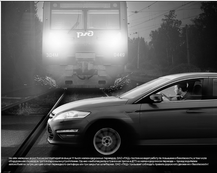
На сети железных дорог России эксплуатируется свыше 11 тысяч железнодорожных переездов. ОАО «РЖД» постоянно ведет работу по повышению безопасности, в том числе оборудованию переездов приспособленными устройствами. Однако наиболее распространенной причиной ДТП на железнодорожных переездах — после выезда автомобиля на запрещающий сигнал светофора или запрещающие знаки, ОАО «РЖД» призывает соблюдать правила дорожного движения и безопасности!

ОСТАНОВИСЬ ДО ПЕРЕЕЗДА, ЧТОБЫ НЕ ПЕРЕЧЕРКИВАТЬ СВОЮ ЖИЗНЬ