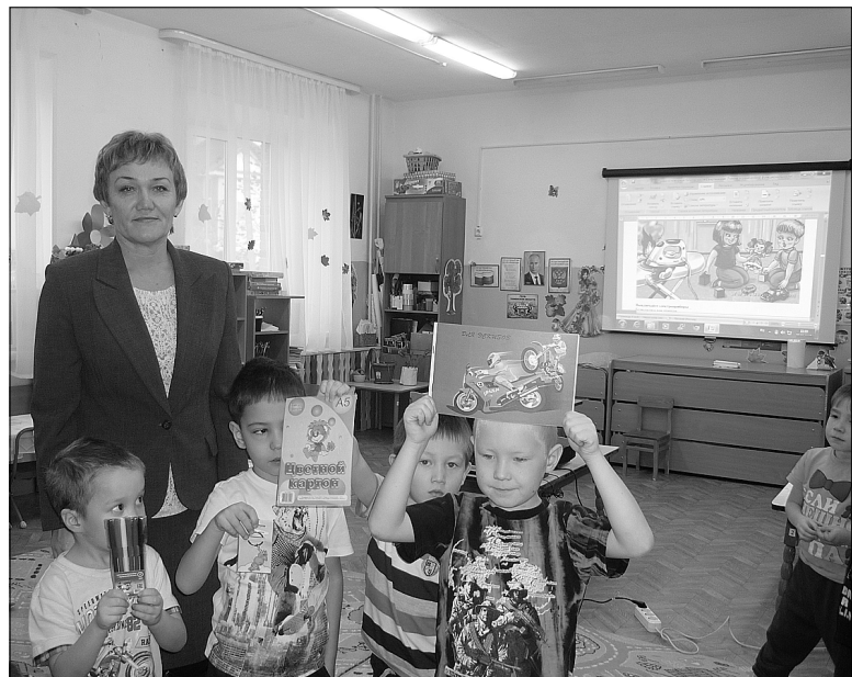
МОНД и ПР N 9.

лучили в ходе занятий, пригодятся им в повседневной жизни. Если ребёнок, прежде чем взять в руки спички или зажигалку, за-