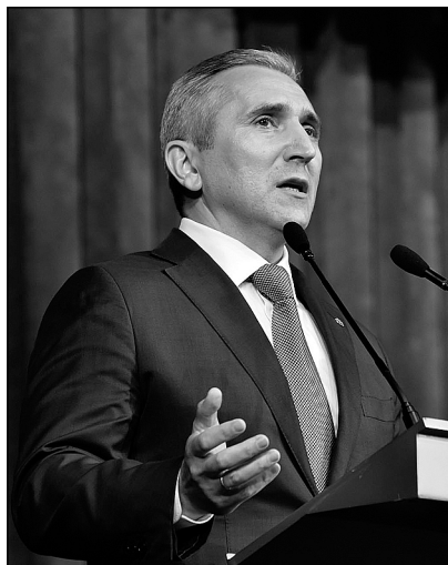
Александр Моор: приоритеты, выбранные ранее для развития Тюменской области, будут сохранены.

Врио главы региона подробно остановился на теме развития дорожной сети Тюменской области. В конце 2018 года будет открыто рабочее движение на последнем участке тюменской кольцевой дороги – от улицы Тополиной до дороги Тюмень – Боровский – Богандинский. Также будет найдено решение и по дороге Мортка (Кондинский район в ХМАО) – Нижняя Тавда. Кроме того,