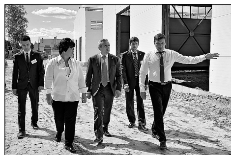
Губернатор Александр Моор в Тюменском районе.

В Боровском в октябре открыли мемориал Герою Социалистического Труда