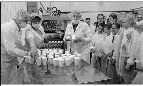
Открытие ООО «Ландис».

Каждая территория «столичного» по-своему уникальна и везде есть интересный опыт. Важно знать, что полезного для людей делается у соседей, и пытаться использовать этот опыт у себя. Этот принцип лёг в основу работы сельских и районной дум в «столичном» на предстоящий год.