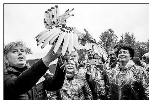
Фестиваль яйца в Каскаре.