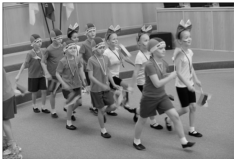
У «Фантазёров» из п.Московский – диплом первой степени.

ученики первого класса и воспитанники подготовительной к школе группы Московской школы. По задумке наставника ребят, инструктора по физической культуре структурного подразделения Московской школы