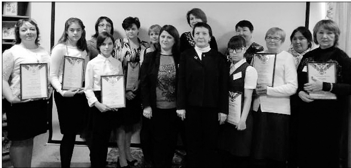
Участники IV читательской конференции «Семья. Чтение. Книга».