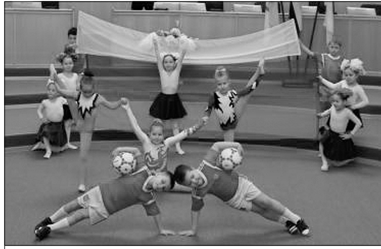
Отличная команда «Боровские ребята».